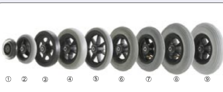
Rodas da frente ① 75 x 24 Maciças (3"), ② 100 x 27 Semi maciças (4"), ③ 125 x 27 Semi maciças (5"), ④ 140 x 37 Macia (5,5"), ⑤ 150 x 27 Semi maciças (6"), ⑥ 150 x 30 Macia (6"), ⑦ 150 x 32 pneumáticas (6"), ⑧ 180 x 40 pneumáticas (7"), ⑨ 180 x 40 Macia (7")