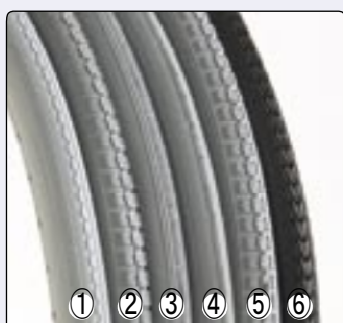
Pneus ① Maciço, ② Pneumático profile ou anti-furo, ③ Pneumático sem marcas, ④ Low profile, ⑤ Pneumático profile ou anti-furo, ⑥ Marathon Evolution.