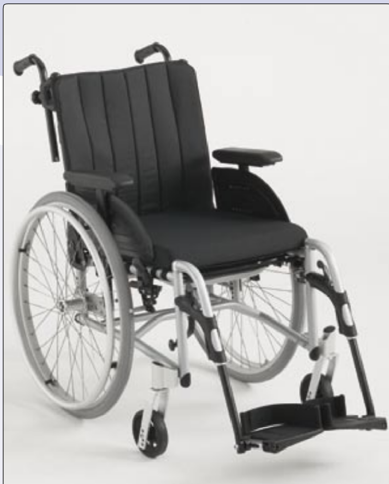
Apoios de pernas destacáveis Para um maior conforto e facilidade nas transferências.