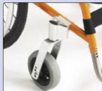
Forquetas das rodas da frente Desenhadas para uma maior estabilidade e performance.