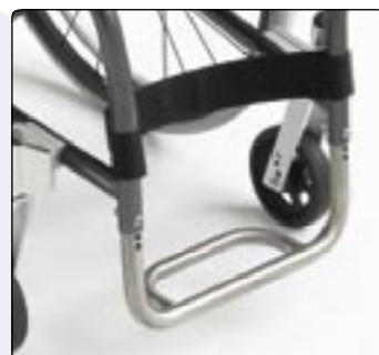
Patim em titânio Para um melhor conforto e menor peso.